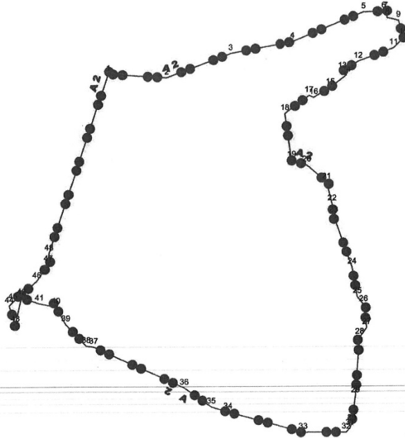
SİT ALANI SINIRI KOORDİNATLARI (UTM 3 DER. TRF)